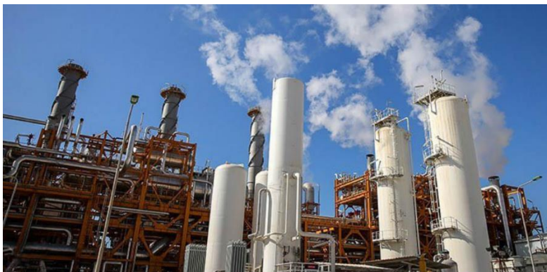
تجهیزات پارس جنوبی در نزدیکی عسلویه

کرد، که به آن‌ها در محکوم کردن جانشین سابق مدیرکل بانک دولتی ترکیه؛ هالک‌بانک، به علت نقض تحریم‌ها کمک می‌کرد.